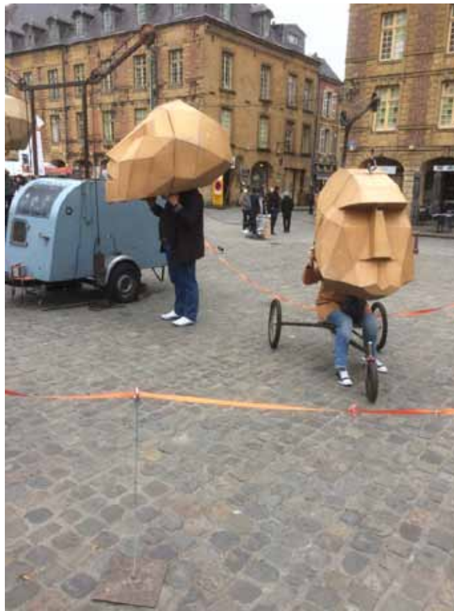
En två minuters mekanisk dockteater presenterades inuti dessa huvuden!