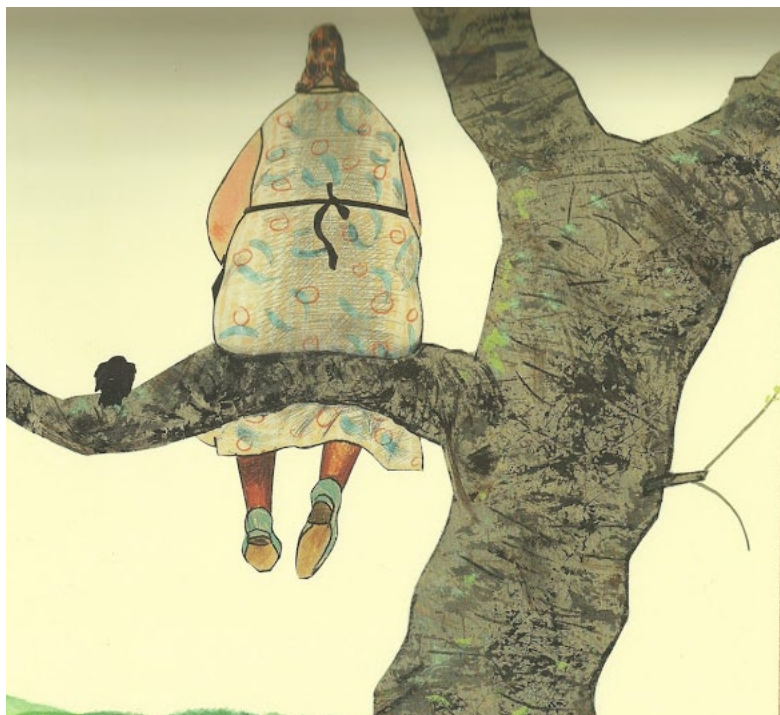
Wolf Erlbruch: Fru Meier och koltrasten . Boken har just (maj 2017) kommit ut på Förlaget Hjulet i svensk översättning av Ulla Forsén.

Det viktiga för Eva är att huvudfiguren ska vara möjlig för småbarnspubliken att identifiera sig med. Alltså får den inte bli för abstrakt. Eller jo, förresten (ändrar hon sig), den kan få vara abstrakt också, men den måste ha en blick, den måste skapa kontakt med åskådaren. Därtill kommer förstås att hitta de viktigaste rörelsefunktionerna. Också valet av tillverknings sätt (ibland mjuka tygdockor, ibland "skulptera, gjuta, cachera", ibland "hugga och tälja", som hon kallar det) ger dockorna deras olika karaktärer.