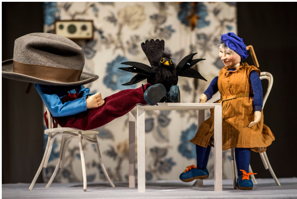
Teater Spektaklet: Fru Meier och Lilla Pip , efter en bilderbok av Wolf Erlbruch. Dockor och scenografi: Eva Grytt.

Banden mellan bilderboken och dockteatern är av förklarliga skäl täta. Historierna är ofta korta och episodiska, ett format som passar dockteatern väl. Kreativa illustratörers bilder liksom bara väntar på att flyttas över till dockteaterscenen av kreativa dockmakare. Men hur ser ett äktenskap mellan två så starka kontrahenter ut? Vilka frågor och utmaningar ställer det dockmakaren inför?