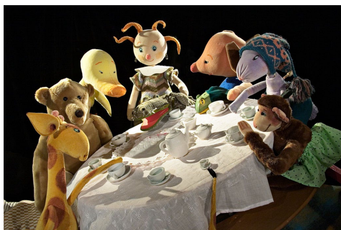
Dollans dagis .