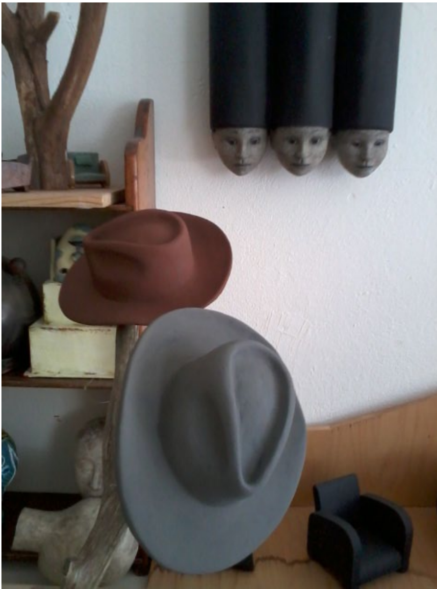
I ateljén: arbeten pågår.