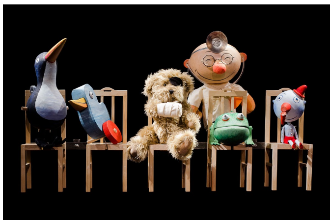
Min tur .

Men hur var det nu med äktenskapet mellan bilderbok och dockteater? Handlar det om att reproducera och återskapa eller att tolka eget och skapa nytt? Fågel, fisk eller mittemellan? Förhållningssätten kan förstås vara skiftande.