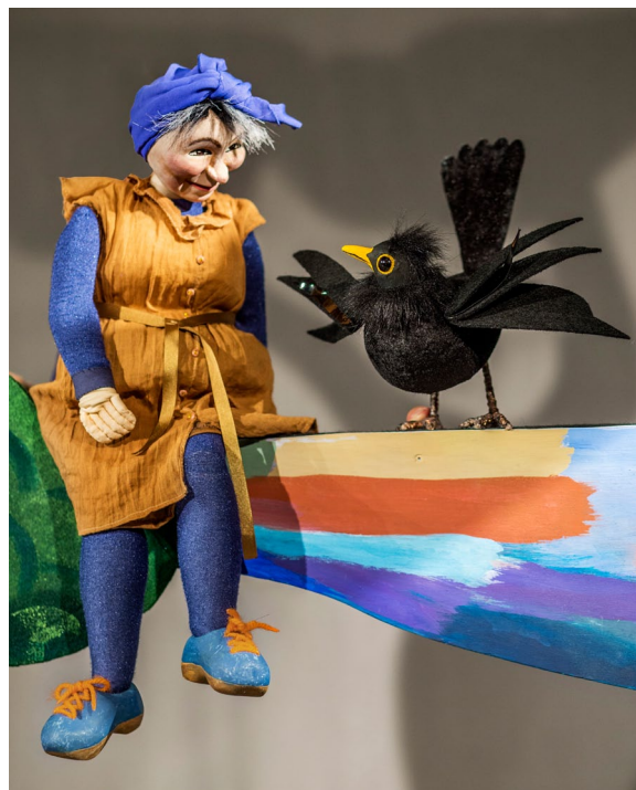
Teater Spektaklet: Fru Meier och Lilla Pip.