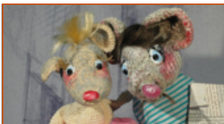
Mäuseken Wackelohr Tandera Theater / Tesdorf. Text: Hans Fallada (1893 -1947).