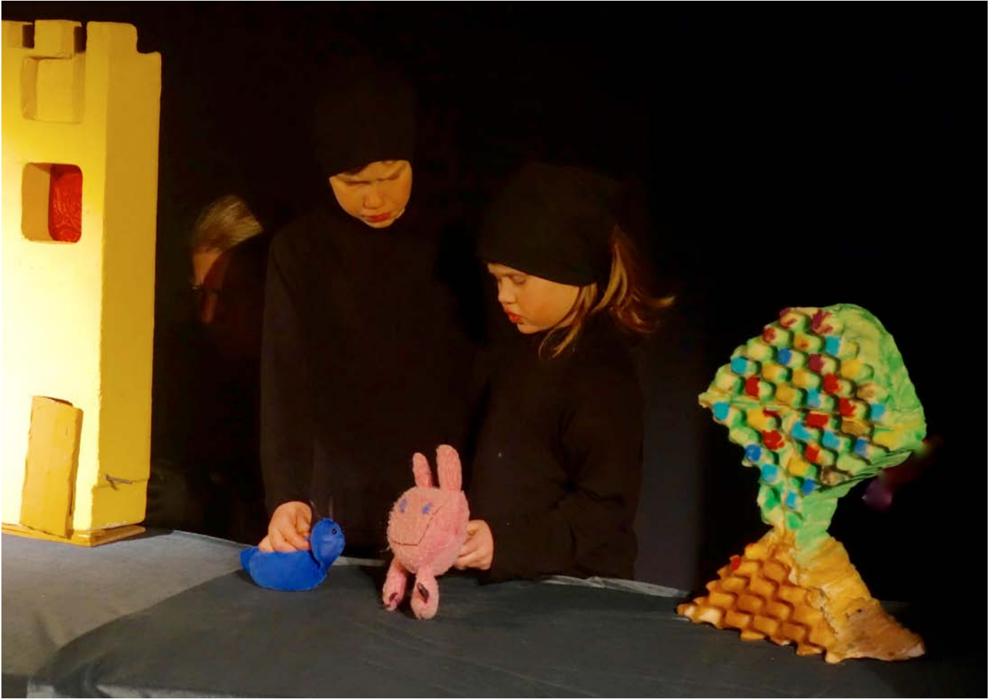
Snigeln ber hunden om hjälp.

”Det var en gång tre vänner, Hunden, Katten och Musen, som seglade sitt skepp på det stora havet. En natt får de ett brev med rop på hjälp. Det är från en snigel på Häxornas Ö. De tre häxorna mår inte bra. Något har gått på tok i deras trollerikonst. När de tre vännerna till slut når fram till ön, får de möjlighet att ställa allt till rätta. Men innan dess har de själva råkat ut för häxornas galna trollerier. Allt slutar väl med tårtkalas och dans.”